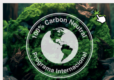
Guía de descarbonización