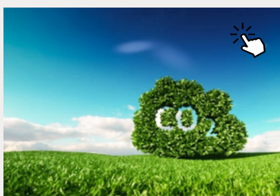
Mitigar y compensar su huella